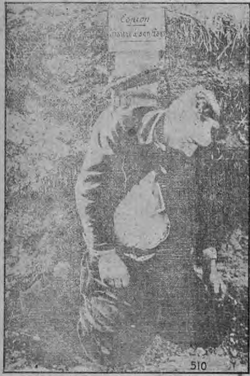
Por 100 francos, este soldado señaló la posición de una batería francesa a los alemanes cerca de Reims. Fue descubierto en el acto y ejecutado sumariamente. Su cuerpo fue colgado de un poste y expuesto por 24 horas con un letrero: "Espía, traidor a su país."